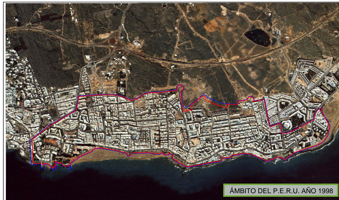
ÁMBITO DEL P.E.R.U. AÑO 1998