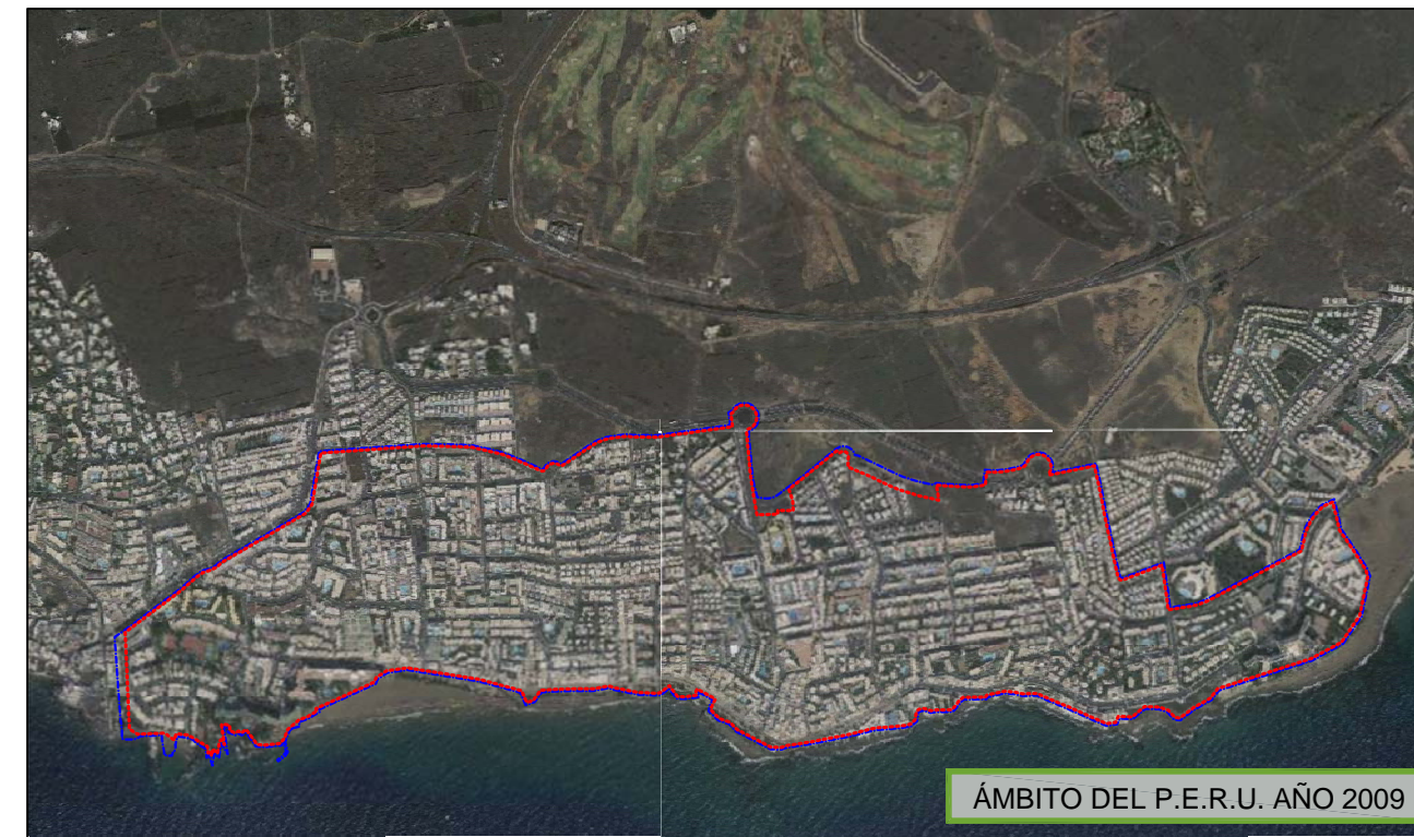
ÁMBITO DEL P.E.R.U. AÑO 2009