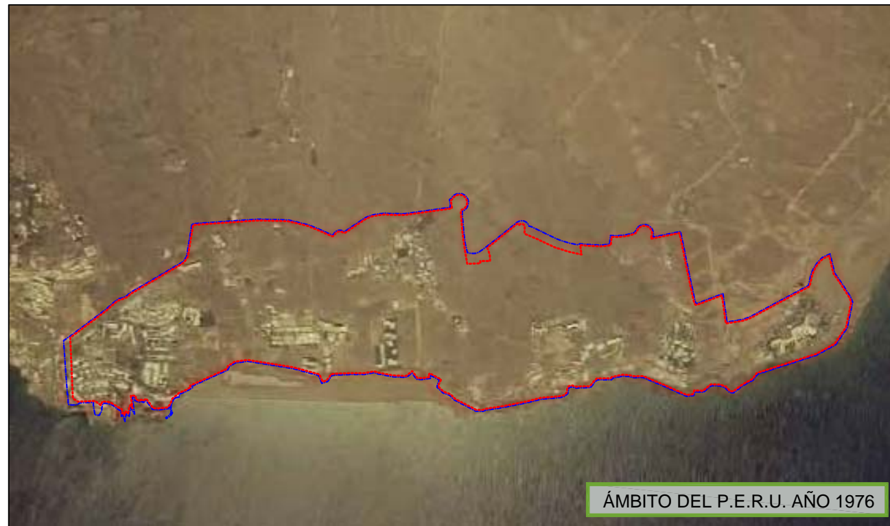
ÁMBITO DEL P.E.R.U. AÑO 1976