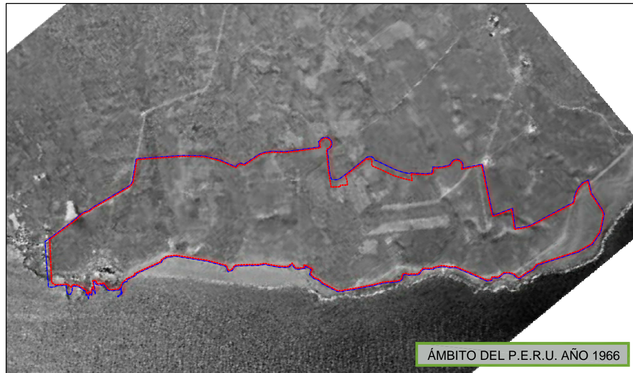
ÁMBITO DEL P.E.R.U. AÑO 1966