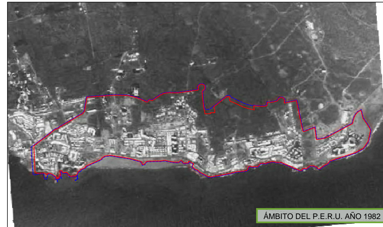
ÁMBITO DEL P.E.R.U. AÑO 1982