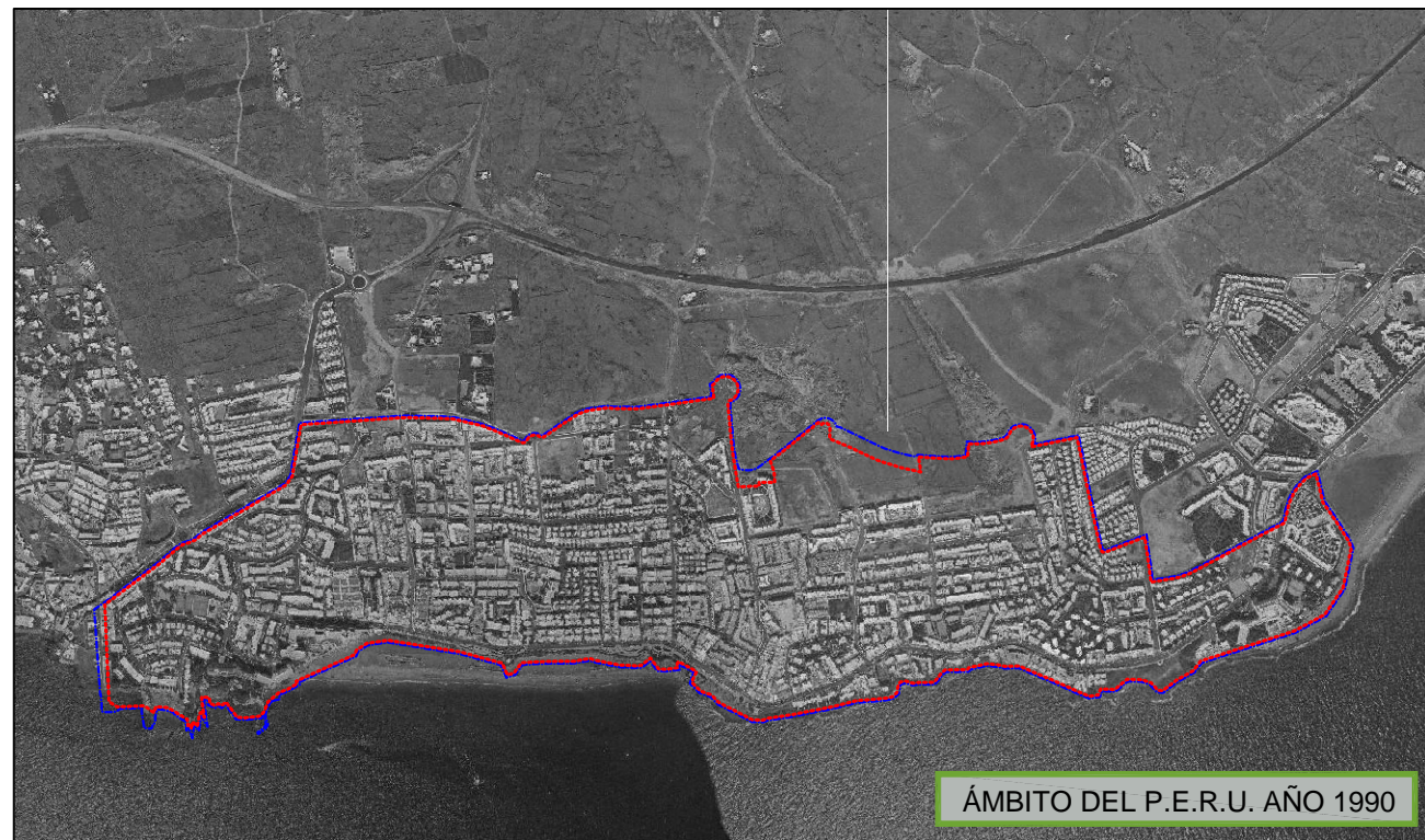
ÁMBITO DEL P.E.R.U. AÑO 1990